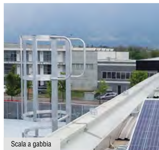
Scala a gabbia