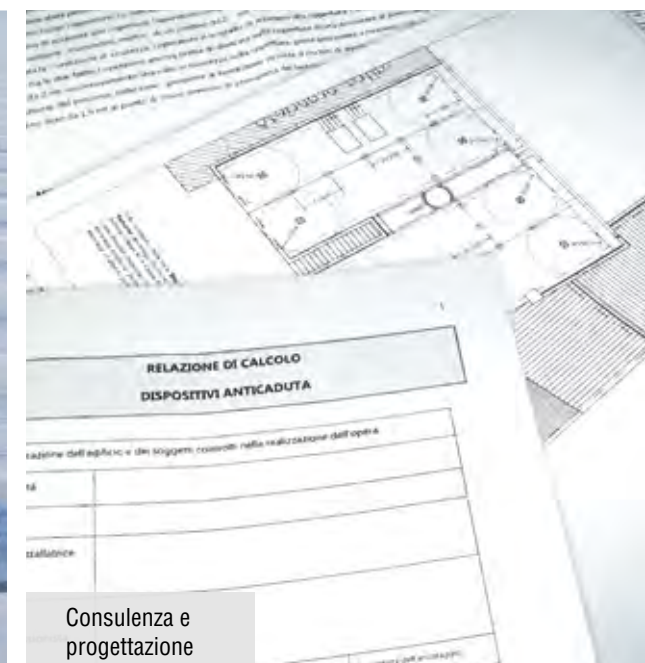
Consulenza e progettazione