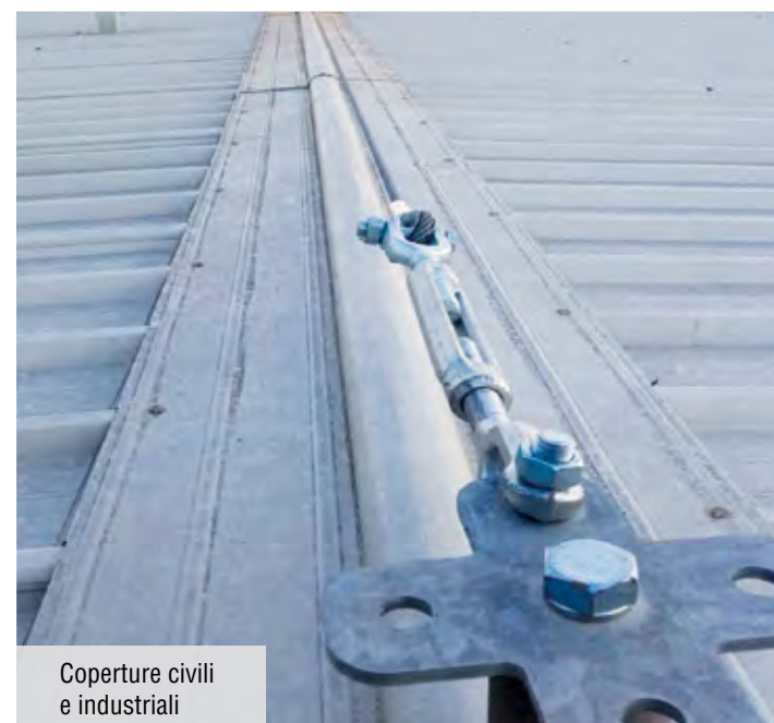
Coperture civili e industriali